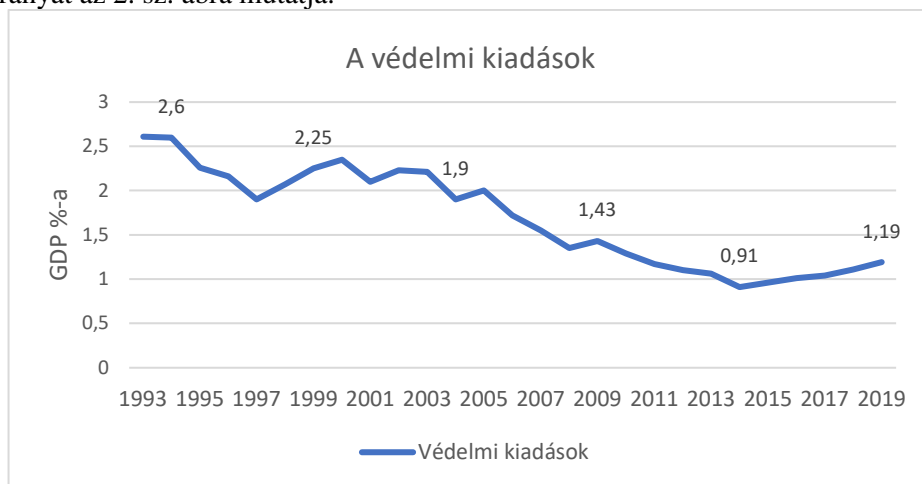
2. Ábra: A védelmi kiadások GDP-hez viszonyított aránya (szerkesztette a szerző a [7] [8] alapján)

A napjaink és a jövőbeli biztonsági kihívásokra történő hatásos reagálás érdekében a Cseh Fegyveres Erő fejlesztése nélkülözhetetlen, a feladatainak meghatározása alapján a képességek és követelmények hozzárendelésre kerültek, amely behatárolja a haderőfejlesztés irányvonalait, legfontosabb elemeit. Ennek megfelelően a kormány biztosítja modernizációhoz szükséges anyagi támogatást. A Védelmi Minisztérium költségvetése az elmúlt néhány évben növekedett, amellyel biztosítani kívánják a fejlesztéseket és a szükséges egyéb költségek fedezetét. A minisztérium közel húsz éves kiadásának GDP-hez viszonyított arányát az 2. sz. ábra mutatja.