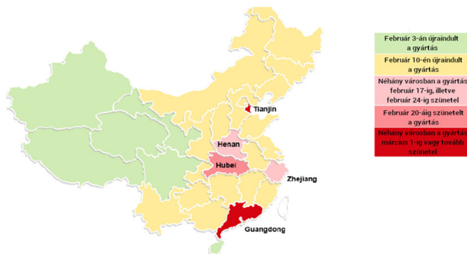
1.ábra: Kína területi egységei a koronavírus járvány okozta leállítás idején [3]