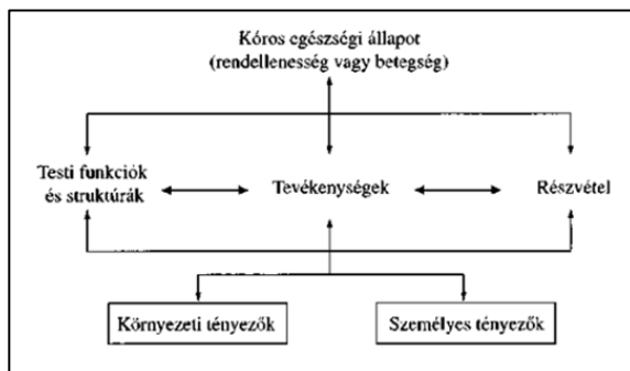
1. Ábra: Az FNO alkotóelemeinek kölcsönhatása, [5]

Az FNO szerint a fogyatékoság különböző tényezők közötti kölcsönhatás lsd. 1. ábra. Az egészségi állapotunk, a környezet és a személyes tényezőink is befolyásolják az életünk három dimenzióját, ezekkel együtt hatnak a funkcióképességünkre és mindezek között kölcsönhatás is van. A fogyatékoságot, akadályozottságot nem kizárólag a testi funkciók kiesése eredményezi, hanem a környezeti és a személyes tényezőknek is jelentős szerepük van. Hiszen egy küszöb és lépcső nélküli épületben kerekesszéssel akadályok nélkül lehet közlekedni, míg magas küszöbökkel és lépcsőkkel teli épületben nem, tehát a fogyatékoságot, az akadályozottságot nem a mozgásszervek funkciókiesése eredményezte, hanem a környezet. Az FNO nem magát a betegséget, az elváltozást veszi figyelembe, hanem a teljesítőképeséget, a részvételt, a tevékenység elvégzését, illetve akadályozottságát, és a környezet támogató, vagy akadályozó szerepét, attól függően, hogy milyen hatása van az ember funkcióképességére. [5]