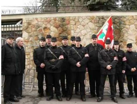
7.ábra: Pax Hungarica Mozgalom