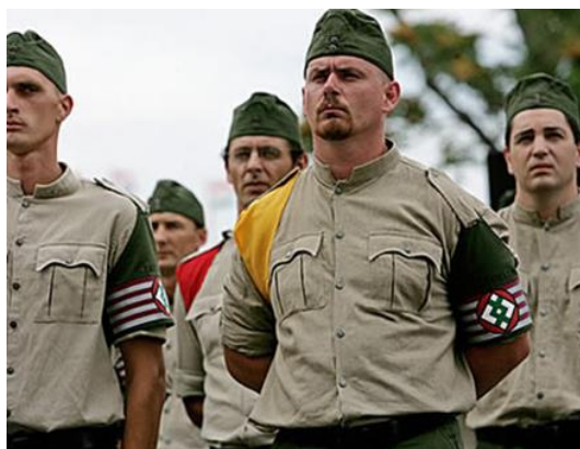
6.ábra: Nemzeti Őrsereg

Nemzeti Őrsereg 2007-ben alakult. Tevékenységének elkülönült profilja nehezen értelmezhető. A Magyar Gárdával szoros szövetségben álló szervezet zöldinges tagjai kar-szalagjaikkal a leventemozgalom és a nyilas pártszolgálatos közötti átmenetet testesítették meg. A főként Észak-Kelet-Magyarországon aktív szervezet (alapvetően Szabolcs-Szat-már-Bereg megyében) legjelentősebb sajtónyilvánosságra a 2008-as szlovákiai (Királyhel-mec) demonstrációval tett szert, amikor is a helyi hatóság őrizetbe vette és később kiutasí-totta 28 egyenruhás tagjukat.