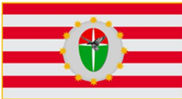
8.ábra: A Pajzs Szövetség jelképe

A másik legjelentősebb Kossuth téri szervezet, a Magyar Nemzeti Bizottság 2006 vezető szervezői, ideológusai között megtaláljuk Halász Józsefet, a Pajzs Szövetség vezetőjét. (A szervezet megnevezése megegyezik a japán tradicionális egy meghatározó alakja, fanatikus mártírja, Misima Jukio szervezetének nevével.) A Pajzs Szövetség 2006. október 15-én – a nyilas hatalomátvétel évfordulóján – deklarálta politikai programját, amely a Szálasi által létrehozott Nemzet Akaratának Pártja (NAP) korporációs állam-és társadalomszervezési téziseit képviselte.